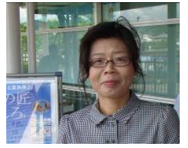
木村レンジャー 得意技：環境