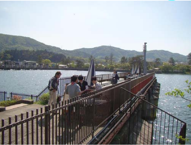
旧洗堰上での開催風景(5/5)

佐々木レンジャーが5月5日(木祝)8日(日)旧瀬田川洗堰上とピクニックデッキにてゴールデンウィークの洗堰レトロカフェを開催しました。「土木遺産の保存と利活用」をテーマとして活動するレンジャーが、旧洗堰の「空間特性」に着目して企画する洗堰レトロカフェは、開催の定例化により住民からの認知度も徐々に高まり、季節のいいこの時期、カフェらしい雰囲気を実現されました。