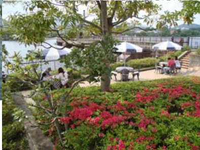
旧洗堰とピクニックデッキを望む

スタンプが飲み物の準備と堆肥の無料配布を行うとともに旧洗堰の説明を行い、さわやかなひとときを楽しんでいただきました。