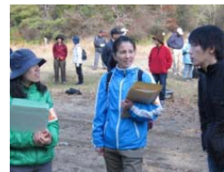
伊東レンジャー 得意技：環境