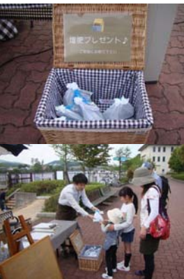
堆肥の無料配布の様子

現在、行政側からの情報としては、河川敷で出た刈草のリサイクルで、リサイクル堆肥の無料配布をカフェ開催時に行っています。そのまま処分すれば、ゴミになりCO 2 を排出する刈草ですが、住民側に堆肥のニーズもあつて有効活用につながります。