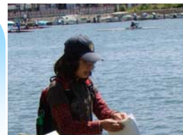
木村レンジャー 得意技：環境