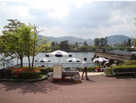
ピクニックデッキでの開催風景(5/8)

スタンプが飲み物の準備と堆肥の無料配布を行うとともに旧洗堰の説明を行い、さわやかなひとときを楽しんでいただきました。