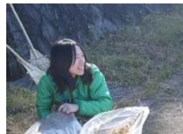
平山レンジャー 得意技：場作り