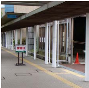
休館日看板を追加設置

今年度よりアクア琵琶の開館日時が平日のみで短縮となった影響で、閉館であることに気付かずにレトロカフェの前を通って館の前で立ち止まる方が散見されるようになりました。また、開館・休館が分かりにくいという声も聞こえてきました。改善案を考える段階では、普段から水のめぐみ館エリアで活動されて