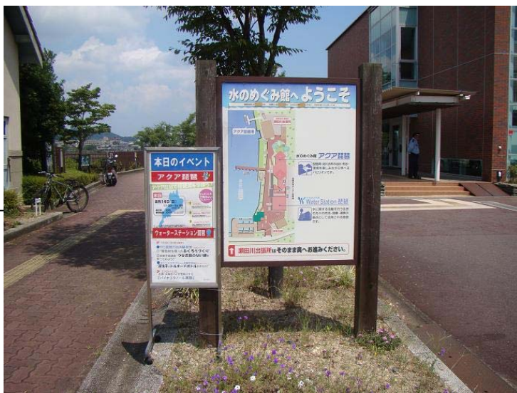
敷地案内の横に「今日のイベント」看板を新設(休館案内も表示)

いる方大変参考になるご意見も頂くことができ、担当課に提案をしました。その結果、河川レンジャーがイベント案内板を設置し、両館がイベント情報を掲載する形で改善の試行を行っています。その他、閉館看板の設置方法の変更など、アクア琵琶、ウォーターステーション琵琶流域連携支援室の協力も頂きながら進めさせて頂いています。