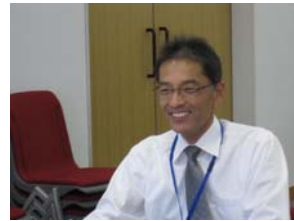
安居レンジャー (活動計画準備中)