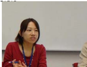
平山レンジャー 得意技：場作り