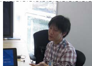
佐々木レンジャー 得意技：水辺の利用