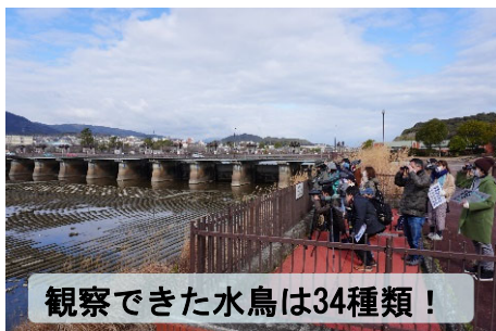
観察できた水鳥は34種類!

瀬田川たんけんたいの第4回目の活動として、令和6年1月27日に瀬田川洗堰周辺にて冬の水鳥観察会を実施しました。草津湖岸コハクチヨウを愛する会の方に瀬田川に飛来する冬の水鳥について説明をしていただきました。