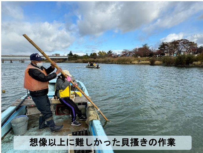
想像以上に難しかった貝掻きの作業

体験を通して瀬田川を知り・深めるたんけんたい活動の一つとして、令和5年11月25日に瀬田川で貝掻き体験を実施しました。瀬田町漁協の方に瀬田川で採取できる貝の種類や現在の貝漁の状況などを教えていただきました。