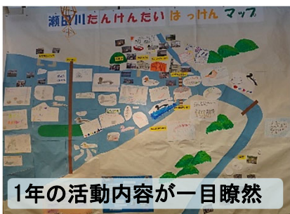
1年の活動内容が一目瞭然

たんけんたい参加者の親子で、1年間の活動中、思い出に残っている活動や、印象的だった活動などを絵や言葉でまとめました。思いのつまった大作のマップができあがりました。