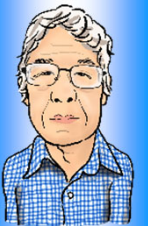
水上 河川レンジャー

第二部では、野洲川中洲親水公園の前の水辺で防災イベントとして防災かまど造りを開催。出来上がった防災かまどで非常炊き出し体験を行いました。 今後も「皆から愛される野洲川」を目指して、行政と住民の橋渡し役として河川レンジャー活動を進めていきます。