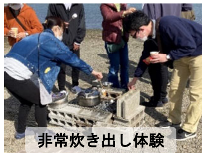
非常炊き出し体験