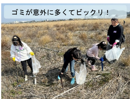
ゴミが意外に多くてビックリ!