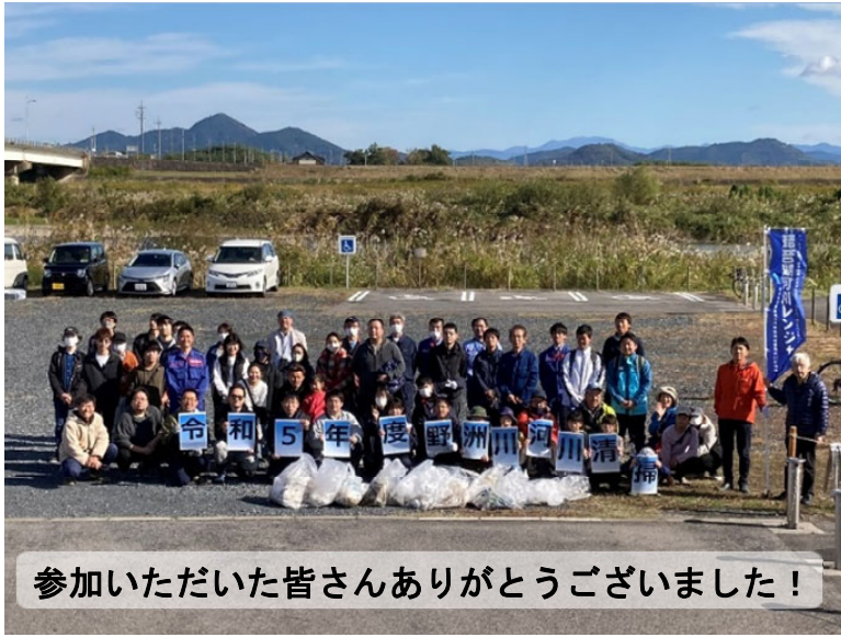
参加いただいた皆さんありがとうございました！

第一部では、野洲川中洲親水公園（あめんぼう）の上下流の河川清掃を行いました。この河川清掃活動は平成29年から6年間毎年実施しています。 今回も行政（琵琶湖河川事務所・守山市）、地元の企業の（株）レイマック、地元自治会の方々合わせて約70名に参加していただき、皆さんと連携した河川清掃活動ができました。