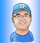
根木山 河川レンジャー