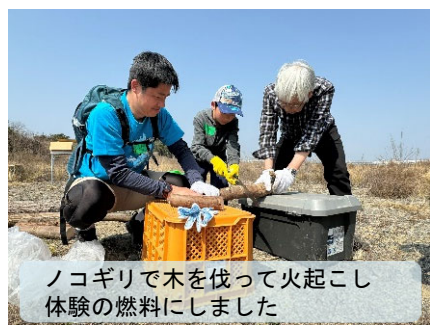
ノコギリで木を伐って火起こし体験の燃料にしました

・ゴミひろいが楽しかった。また参加したいです。 ・川の中には入ってはいけないと思っていて人が多いと思います。今日みたいな活動はとても良い機会でした。