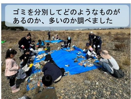
ゴミを分別してどのようなものがあるのか、多いのか調べました